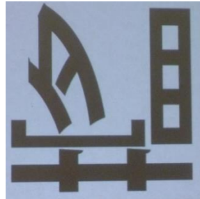
上記の漢字 1文字を当ててね