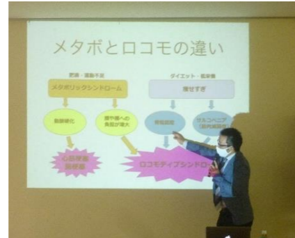
メタボは肥満と運動不足 ロコモは？ 両手じゃんけん