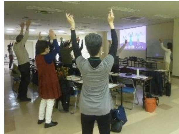
通信カラオケ？指導による懐メロ健康体操