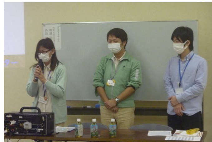
講師は、福寿園ひまわりの皆さん