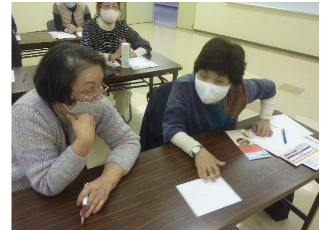
絵で伝言ゲーム（紙を使っても伝わらない）