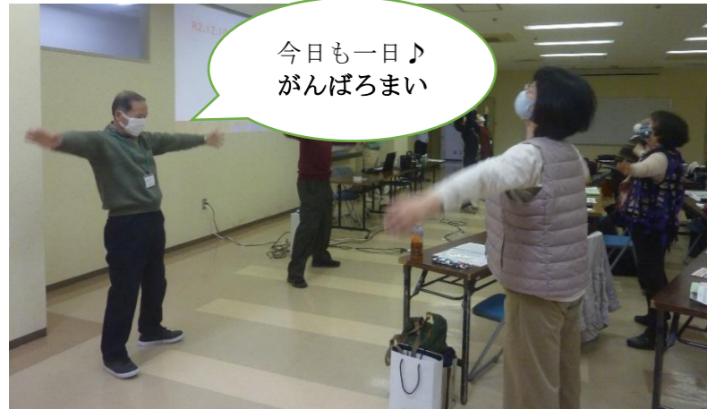
恒例の三河弁ラジオ体操（ここから今日の講座が始まる）