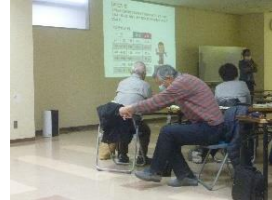
立ち上がりテスト「よっこらっしょっ」